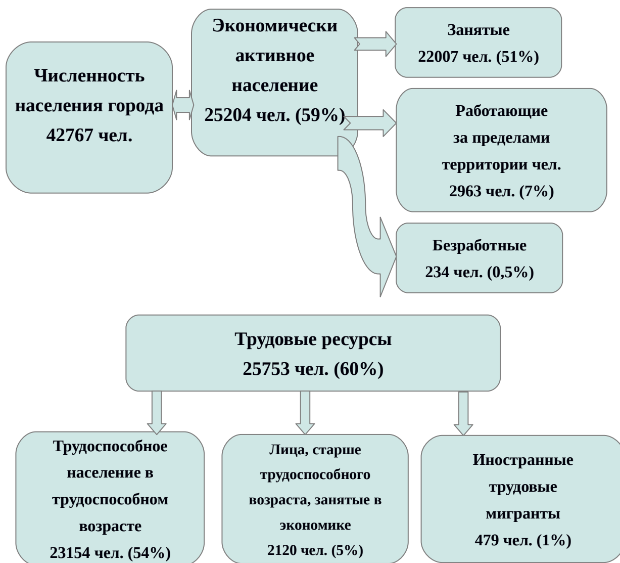
Схема «Трудовые ресурсы города Рассказово»

Из общей численности трудовых ресурсов занято в экономике, то есть работают 85% - 22007 человек.