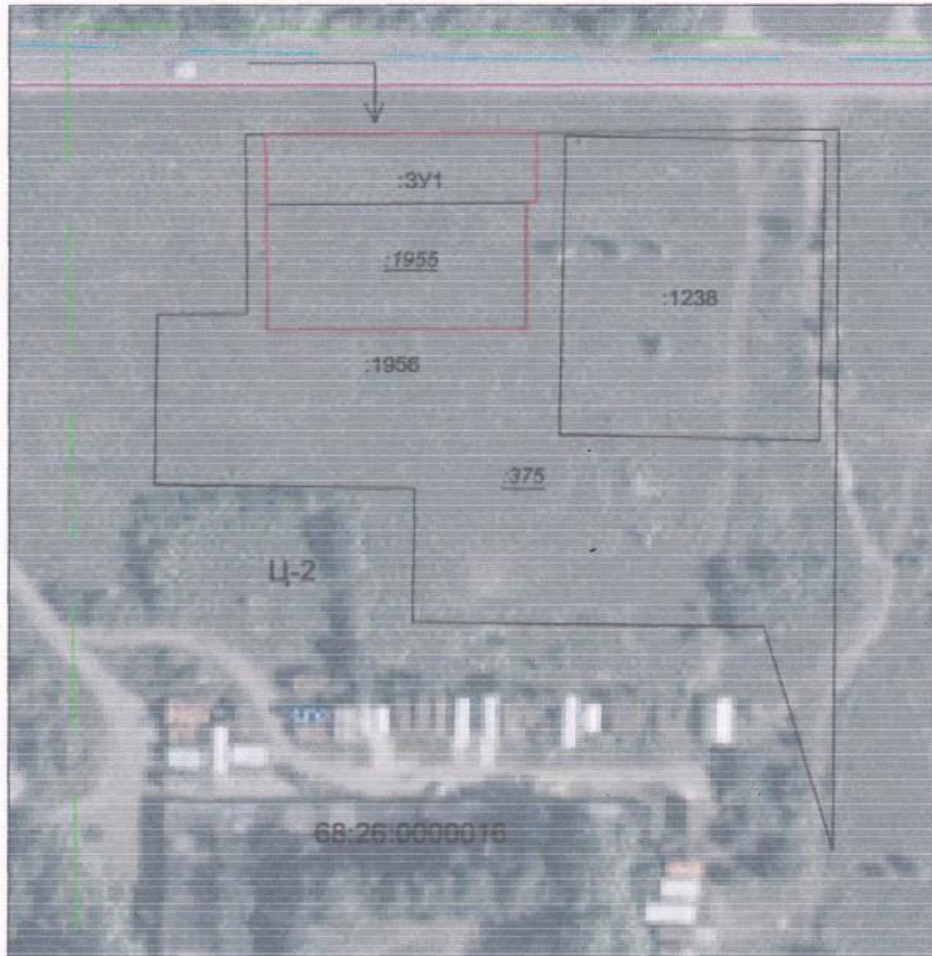
Схема расположения земельных участков на карте города Мичуринска Тамбовской области с указанием красных линий