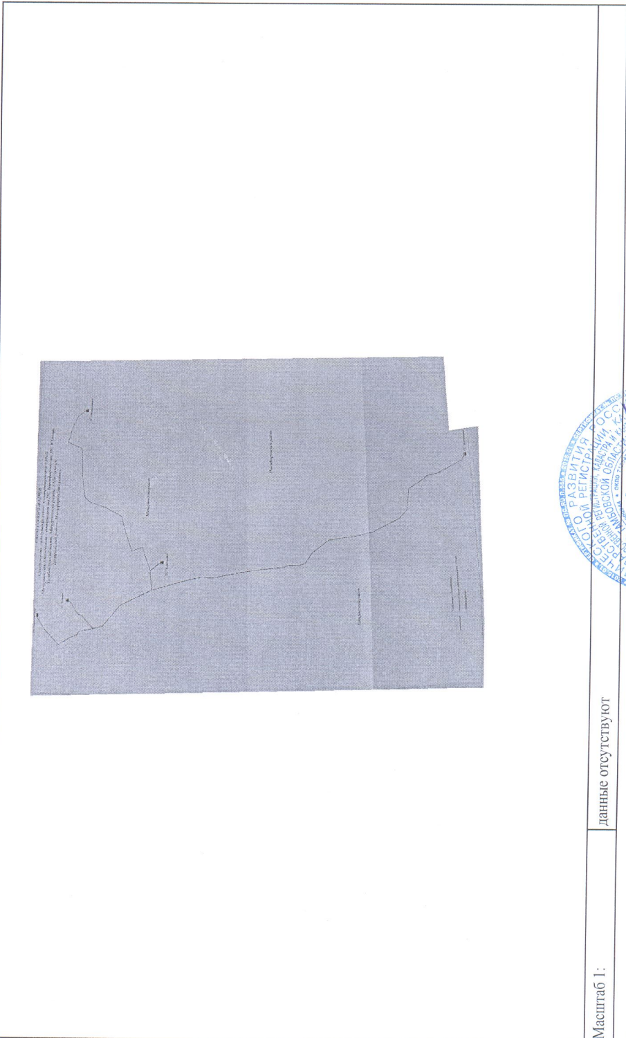
Схема расположения объекта недвижимого имущества на земельном(ых) участке(ах):