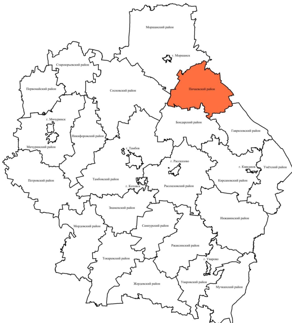
Рис. 1. Схема административно-территориального деления Тамбовской области.